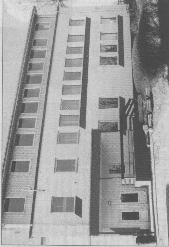
Štai taip dabar atrodo kadaise sukiužęs vaikų darželis.

gamina vandens talpyklas, pirties krosneles, šašlykines ir kitus daiktus. Be to, bendruomenė laiko kėdaičių. Jos gyventojai kartais talkina vietas ūkininkams, su kuriais labai gerai sutaria. Prieš kelerius metus patys įsirengė katilinę, kūrenamą šiaudais.